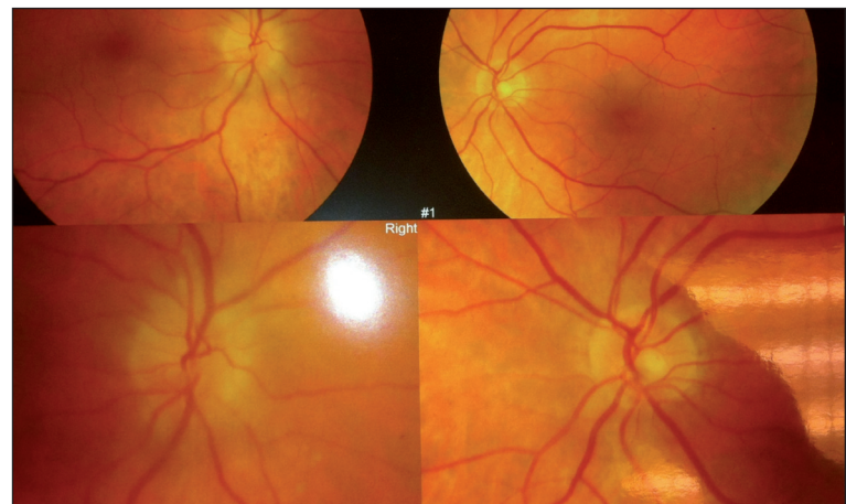
Figure 1. Œdème papillaire dans le cadre d'une NOIAA non artéritique.

La NOIAA se manifeste par une baisse de l'acuité visuelle variable de survenue brutale, indolore sauf en cas de céphalées qui orienteront alors le diagnostic vers une forme artéritique. L'examen de l'oculomotricité, du segment antérieur sont sans particularité en dehors d'un éventuel déficit pupillaire afférent relatif. Le fond d'œil retrouve un œdème papillaire unilatéral, si le patient est examiné en phase aiguë de la pathologie (figure 1). Le fond d'œil controlatéral peut mettre en évidence une petite